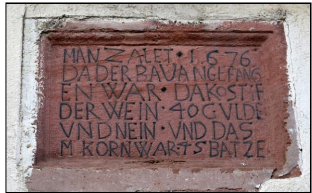
Rhodt unter Rietburg, Weinstr. 71, Inschrift am ehem. württembergischen Amtshof

Wappenschild geschmückt ist, augenscheinlich eine heraldische Verbindung mit Württemberg. Neben diesem Bogen befindet sich eine zweite, ebenso hohe Einfahrt, deren Gewände gleichermaßen gearbeitet sind. Beide Bögen werden von einer steinernen, leicht vorkragenden Bedachung beschirmt. In die Mauer zwischen diesen Einlässen befindet sich eine querrechteckige Tafel mit folgender Inschrift: