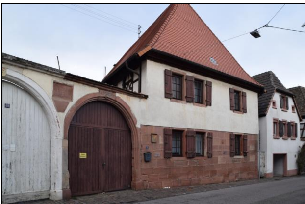
Rhodt unter Rietburg (Südl. Weinstraße), Weinstr. 71, ehem. württembergischer Amtshof (S. Ulrich, 2019)

Das ‚Winzerhaus‘ ist das Thema eines Beitrags, den ich in dem 2018 erschienenen Band 67 des Jahrbuches für Hausforschung vorgestellt habe. 1 Die Abbildung 15 zeigt die Inschriftentafel eines Hauses in Rhodt (Weinstraße 71), das als ein ehemaliger Amtssitz bekannt ist. Zum besseren Verständnis der lokalen Situation ist darauf hinzuweisen, dass das Dorf vom 14. Jahrhundert bis 1603 eine württembergische Vogtei war und anschließend bis zur französischen Revolution als baden-durlachischer Amtsort fungierte. Das Gebäude präsentiert sich zur Straße in massiver Ausführung. Sie trifft allerdings ursprünglich nur auf das Erdgeschoss zu, dessen scharrierte Steinquader mit Randschlag auf das späte 16. oder frühe 17. Jahrhundert hinweisen. Das Fachwerk des oberen Stockwerks wurde nachträglich verputzt. An das Haus schließt sich ein hoher Torbogen an, dessen Scheitelstein die Jahreszahl 1676 sowie die Initialen „SH“ mitteilt und der mit der Darstellung eines Hirsches in einer Art